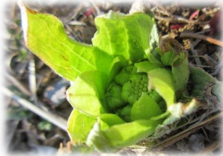
▲中庭のフキノトウ

2月は厳しい寒さや雪が積もった日もありましたが、少しずつ寒さもやわらぎ、三寒四温の季節が来て、暖かく感じられる日も多くなっていくと思います。当センターや周辺でも、春の気配を感じる事ができたので、ご紹介致します。