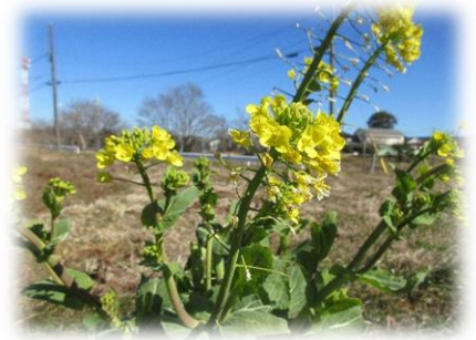
▲さんぽコースで見つけた菜の花