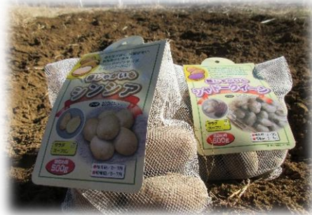
▲春植えのじゃがいも(種芋)